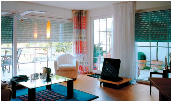
Automatische Endlageneinstellung auf Knopfdruck, auch schon in der Fertigung möglich – komfortabler kann Rollladen-Einbau nicht sein!